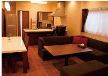
木のぬくもりを感じる癒やしの館内