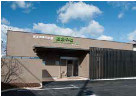
駅から近いきれいな斎場

「悠～はるか～プラン」は、最も多くの方に選ばれている標準的な家族葬プランです。 祭壇及び生花装飾やお選びいただけるオプションも「侘プラン」、「恵プラン」より多く、 20kmまでの寝台車・霊柩車の運行が可能なプランです。