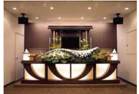
充実した設備・柔軟なサービス