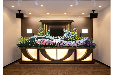
充実した設備・柔軟なサービス