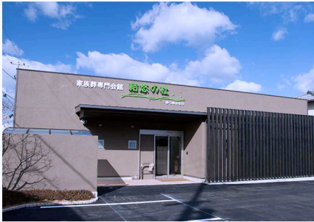
駅から近いきれいな斎場

「直葬（火葬式）プラン 13」は、通夜や告別式などを行わず火葬のみで故人様をお送りする最も費用を抑えたプランです。ただ、お付き合いされているお寺様等がいらっしゃる場合は最初にご相談いただく事をおすすめします。