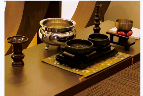
充実した設備・柔軟なサービス