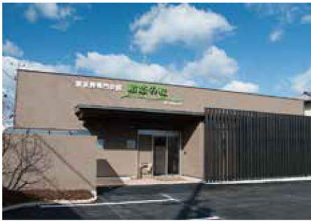
駅から近いきれいな斎場

「恵～めぐむ～プラン」は低価格ながら家族葬に必要なものは全て揃っており、お棺一式に布棺をお選びいただけるようになるなど 選択オプションも増え、メイクアップ納棺（故人様の洗髪・洗顔・お顔剃り・脱脂綿等の取り換え・着付け・お化粧品）等も 基本オプションとしてご用意しています。