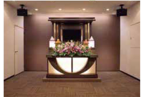
充実した設備・柔軟なサービス