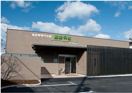
駅から近いきれいな斎場

「結悠プレミアムプラン真想～しんそう～」は上質な生花飾りの祭壇で故人を見送るプランです。 季節の花やデザインでオーダーメイドできます。基本オプションは「結悠プラン」を引き継いでいます。 こだわりの生花飾りで送られたい方におすすめのプランです。