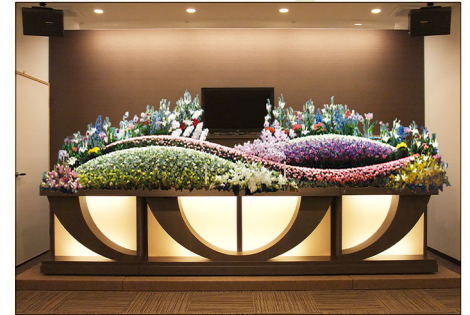
充実した設備・柔軟なサービス