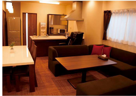
木のぬくもりを感じる癒やしの館内