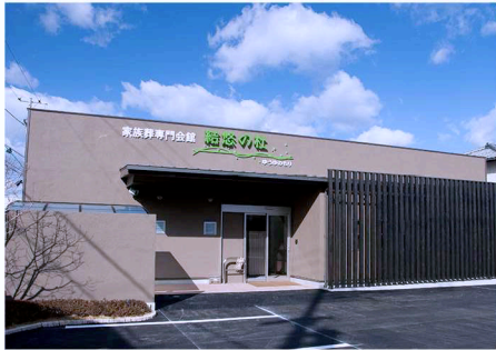
駅から近いきれいな斎場

「結悠~ゆうゆ~プレミアムプラン」は上質な生花飾りの祭壇で故人を見送るプランです。 季節の花やデザインでオーダーメイドできます。基本オプションは「結悠プラン」を引き継いでいます。 こだわりの生花飾りで送られたい方におすすめのプランです。