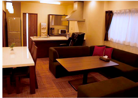
木のぬくもりを感じる癒やしの館内